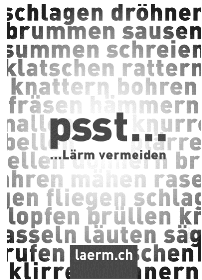
Plakat 2009 und 2010. Format F4, Farben rot-weiss-schwarz

Der diesjährige Tag gegen den Lärm fand am 29. April 2009 statt. Er stand unter dem Motto „Lärm vermeiden“, womit darauf hingewiesen ist, dass wir zu Rücksicht aufgerufen sind und ständig darauf